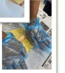
クッキーを作って職員に販売。5分で売れました(^^)