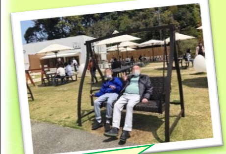
2月のバスハイクで糸島に行きました！

仕事半分、遊び半分をモットーに色々な活動を通して、自立した生活を目指す訓練を行っています。初めての登山やクッキー販売等楽しい活動がたくさんありますよ！