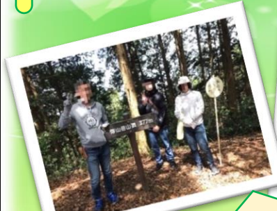
長谷山へ登山に行きました！